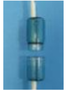
Рис. Б. Аромокапсула дифузора

Дифузор може використовуватися для кисневої ароматерапії. Для цього в ньому передбачена спеціальна розбірна аромокапсула (див. Рис. Б). За необхідності в неї можна помістити губку, просочену ароматичною рідиною. Це допоможе зробити процедуру особливо приємною.